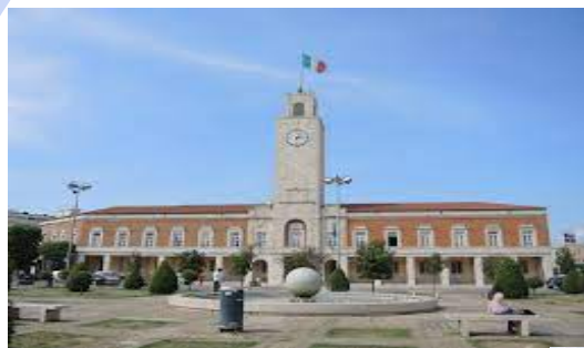
Polo di Latina