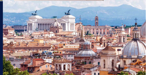
Polo di Roma